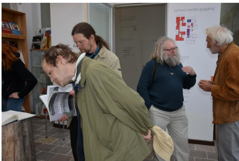
Exkurze do Musea Gugging v Rakousku.