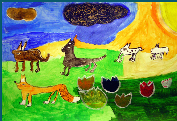
Martin Ambroz, Hon na lišku, 2013