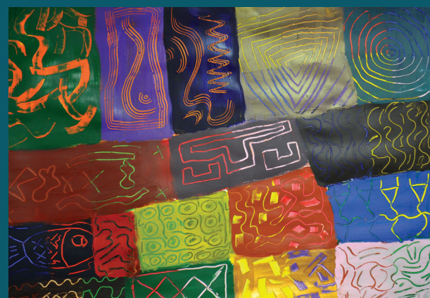
Pavel Chromý, Ryba XXX, 2012